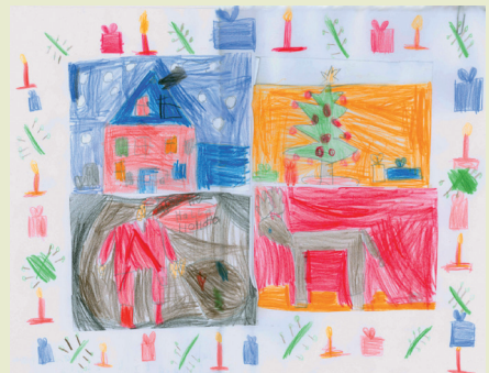
Pia, 7 Jahre