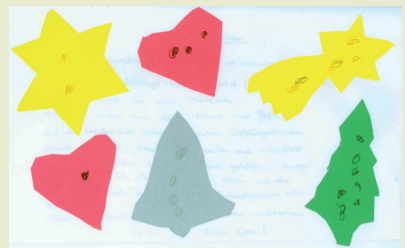
Gerrit, 5 Jahre