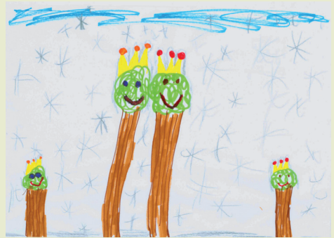
Jette, 7 Jahre