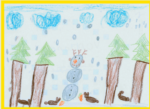
Jana, 7 Jahre, Gewinnerbild der TEDDY-Weihnachtskartenaktion 2012