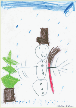
Celestina, 6 Jahre