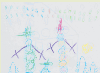
Svea, 4 Jahre