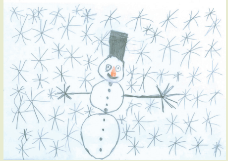
Pia Catarina, 6 Jahre