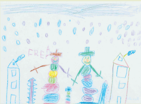
Freya, 6 Jahre